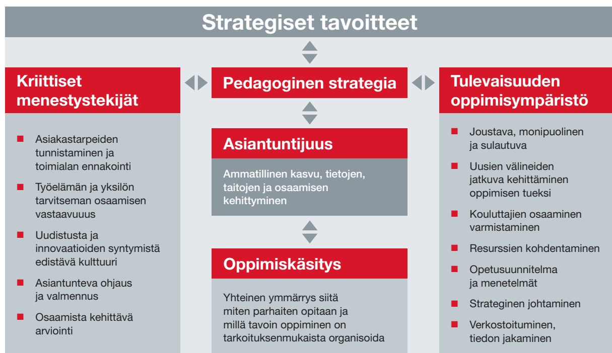
Kuvio 1. Pedagogiseen strategiaan vaikuttavat tekijät